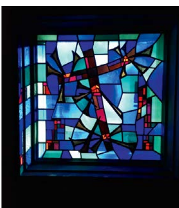
Bildlegende: Die drei Passionsfenster in der Kirche St. Martin, Zuchwil